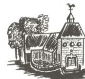
Kapelle St. Josef Eisten

Mutter-Kind-Gruppe: Mittwoch 15:30 – 17:00 Uhr im MGH